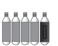
16g Threaded CO2 cartridge Art no. TCOT-6